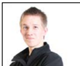
Tekst: Truls Pedersen Aagedal

Crytek sin grafikkmotor versjon 2 kom i år sammen med spillet Crysis som kom nå 15. november. CryEngine ble nærmest en suksess i spillet FarCry som kom i Mars, 2004.