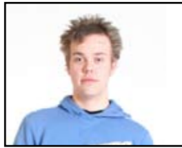
Tekst av: Leif Feltstykke

World of Warcraft: Wrath Of The Lich King er den kommende tilleggspakken til MMOG-spillet World of Warcraft. I tilleggspakken får du omsider møte Arthas Menthil, som var prins i kongedømmet Lordaeron. Du kjenner ham kanskje igjen fra de tidligere spillene Warcraft III: Reign of Chaos og Warcraft 3: Frozen Throne, hvor Arthas' sjel går sammen med den til skapningen "The Lich King." Arthas' trener/mentor var Uther The Lightbringer. Han var før en Paladin helt til han skle inn i galskap og ble en Death Knight og The Lich King.