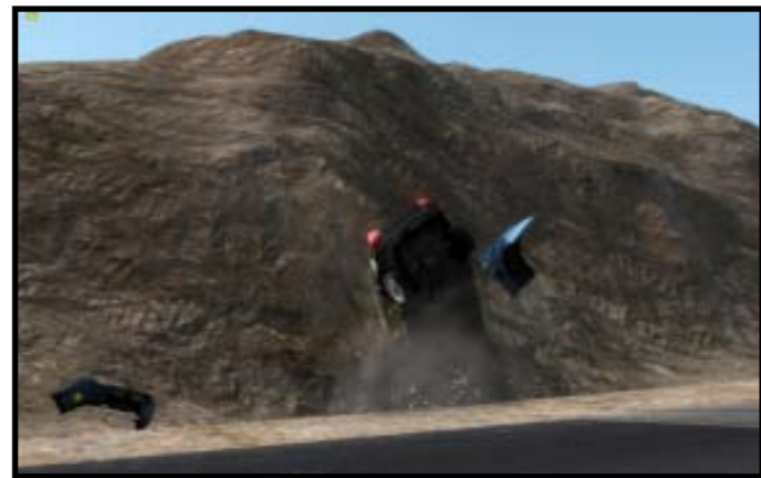
Det finnes ingen fartsgrenser!