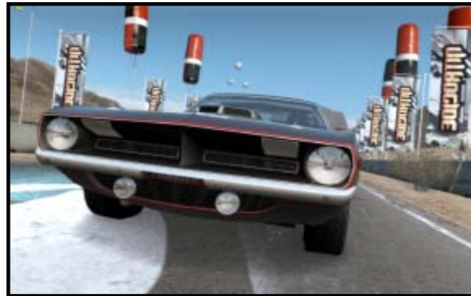
Dragrace med ekte amerikanske muskler!

Tidligere Need For Speed spill har holdt seg til et begrenset område, nå kan du kjøre på globalt nivå! Du kjenner kanskje til Tokyos Shuto Expressway, Autobahn og Nevadaørkenen. Dette er blandt annet steder du kan kjøre på Pro Street. Hvor rått er det ikke å faktisk kunne kjøre en fet gatebil på Autobahn i Tyskland uten å risikere livet? Selve løpene er delt inn i Grip, Drift, Drag og Challenge.