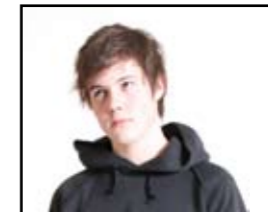
Tekst av: Arvid

via portalene skal du gjennomføre en rekke eksperimenter. Sjefen din er ei maskin som lover deg kake etter hvert eksperiment hun ber deg om å gjøre. Til tross for at det ikke er noe spesielt med action i spillet blir du fascinert av å gå gjennom vegger og tak. I starten er det veldig uvant fordi det er litt småforvirrende å gå gjennom en portal, deretter å havne i taket. Men etter en stund tilpasser du deg til det. Senere i spillet finner du beskjeder på veggene som sier "The cake is a lie" Dette skaper en tankevekker om at kanskje ikke disse eksperimentene er så trygge som først antatt. Man får en liten Half-Life følelse når man spiller portal, samtidig som spillene er ganske forskjellige.