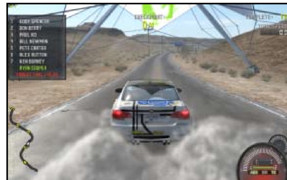
Ligger du langt bak? Bruk NOS!

Prisen på Need For Speed: ProStreet varierer fra konsoll til konsoll, men den ligger på rundt 400-500,- kroner.