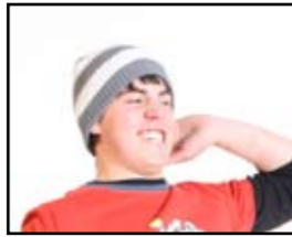
Tekst av: Eldar Tzur

Nå som du skal lese denne avisen, kan det være greit å vite hva alle disse forvirrende uttrykkene som "FPS", "RPG" og "MMOG" betyr. Her er noen forklaringer på de mest kjente sjangrene innen dataspill per i dag. Vi forklarer hovedforskjeller, likheter, og hva du generelt bør forvente av den sjangeren.