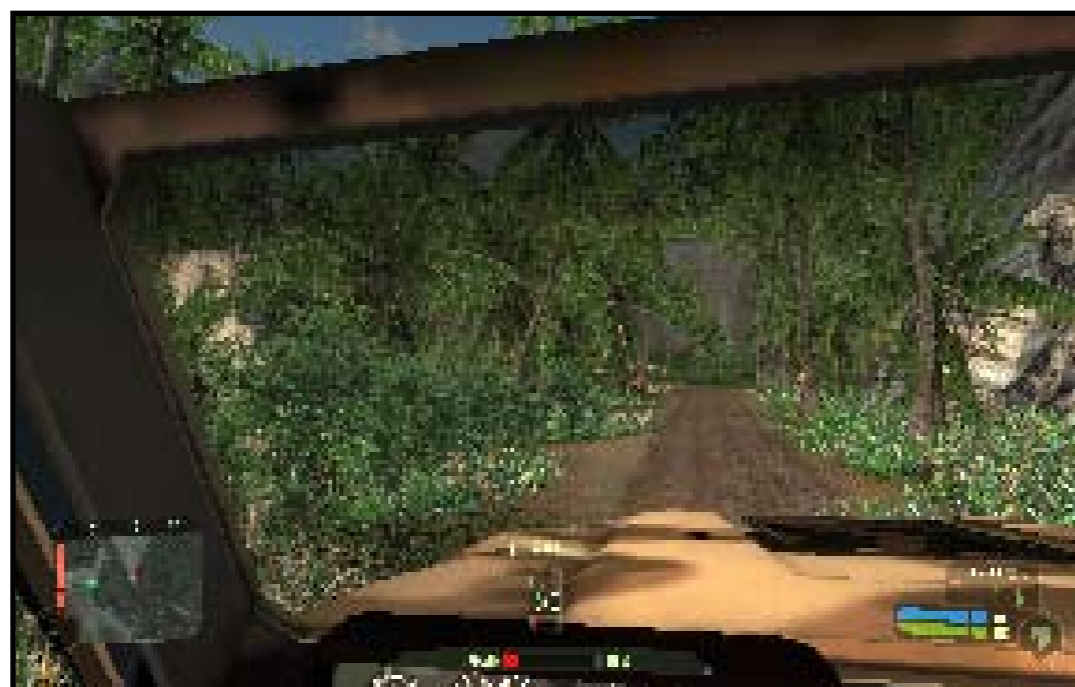
Bildet er tatt fra Crysis Pre-Demoen som kom 26. oktober.

Lei av det trege og kjedelige programmet for utpakking av .zip filer som følger med Windows? Da er WinRAR noe for deg. Programmet inneholder mange funksjoner som gjør det lett å pakke ut og pakke inn filer og det støtter de aller fleste formater. Det inneholder også en komprimeringsteknologi som pakker filene enda tettere sammen, og som minsker filstørrelsen ytterligere. Lastes ned gratis på "www.rarlab.com".