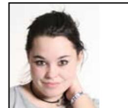
Tekst av: Tanita og Vegar