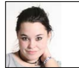
Tekst av: Tanita og Vegar