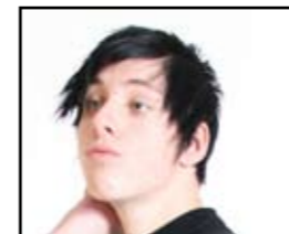
Tekst av: Daniel