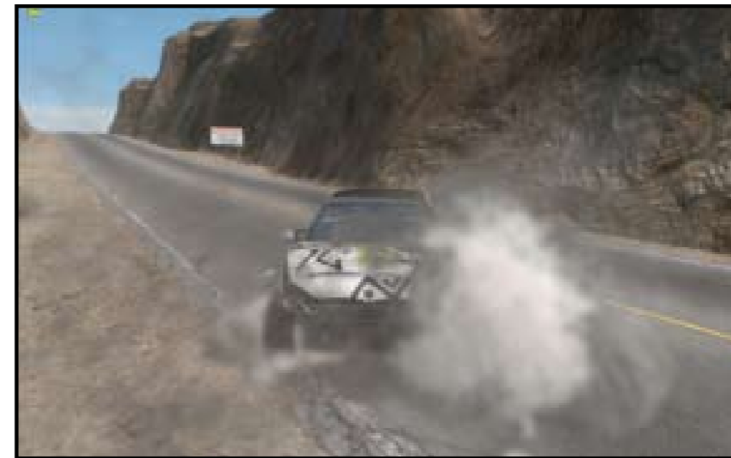
Her kan du tydelig se røyk effektene i den nye teknologien.

Men jeg ble overasket over røykeffektene som har blitt brukt i dette spillet, det som er mest kjent innen streetracing for tiden