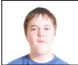
Tekst av: Erik Nupen

Assassin's Creed har vært et av de mest forventede spillene i spillåret 2007. Nå den 16. November har det endelig kommet ut og jeg, ved Spillavisen ved Molde VGS har testet det.