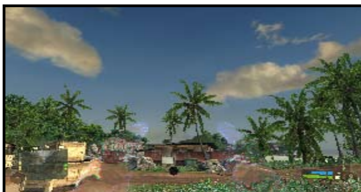
Bildet er tatt fra Crysis Pre-Demoen som kom 26. oktober.