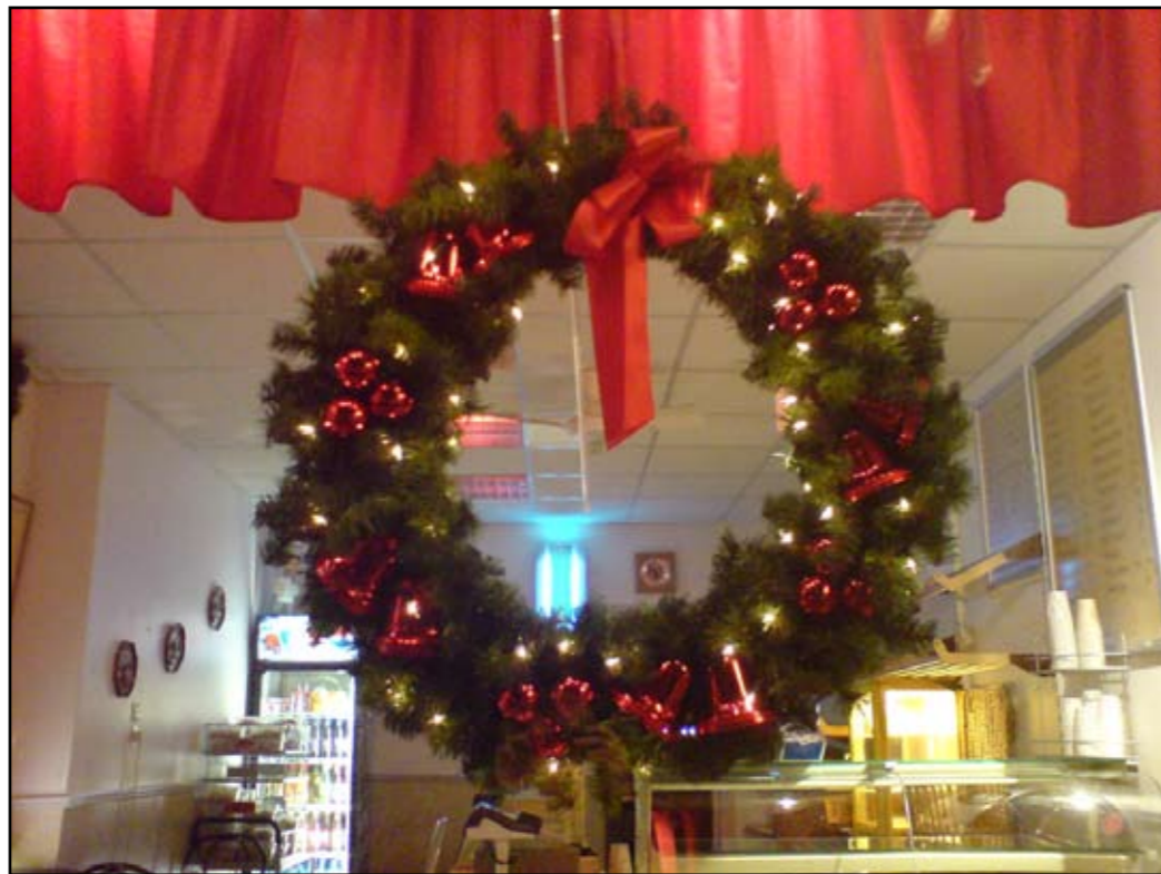
Julekrans: Julekransen kan man finne hengende i mange vinduer og på mange dører. Den blir ofte ansett som en viktig pyntegjestand for et hjem. Som man ser på dette bilde er den ofte pyntet med julekuler, klokker og sløyfer.

Man kan nesten ikke forestille seg en jul i Sverige, uten et godt pyntet juletre. Pynten består som regel av engler, kuler, glitter og julelys. Svenskene elsker også musikk og sangleker, og blant de sangene som man synger og leker