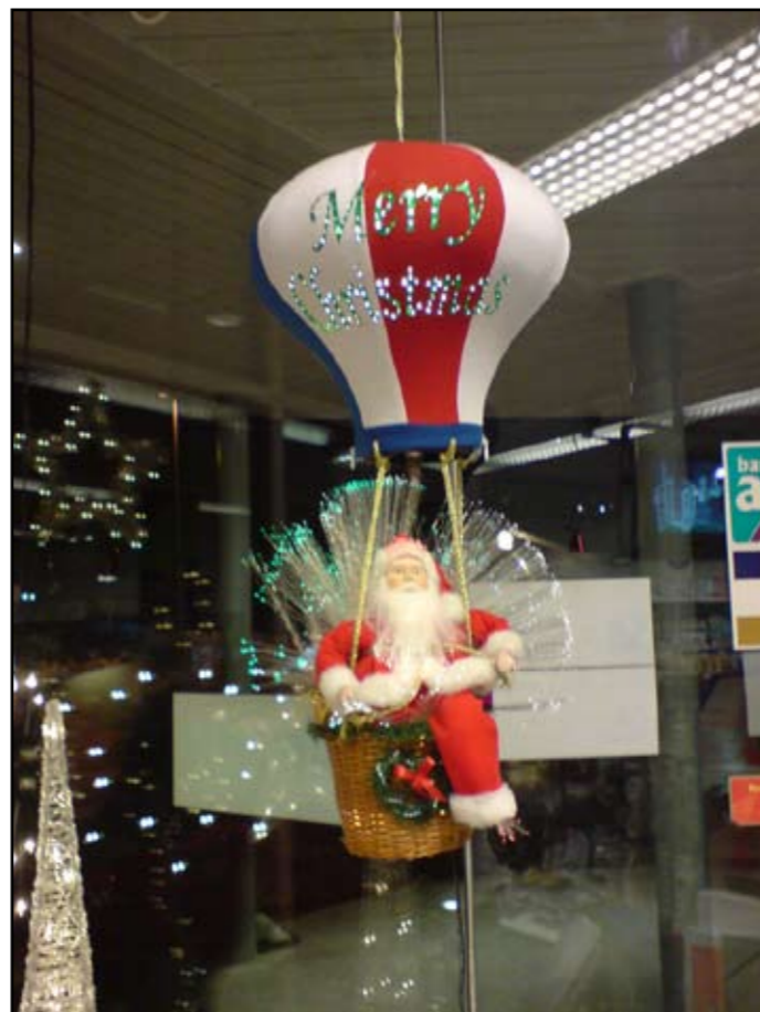
Julenisse: Julenissen er en kjent figur når julen kommer. Her er en litt uvanlig utgave av en i nisse i en ballong.

Den 24. desember er "Christmas Eve", og barna henger strøpene ved sengen eller på ovnen.