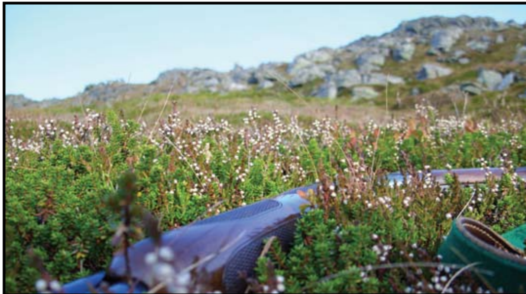
Kultur?: Kultur kan være så mangt.