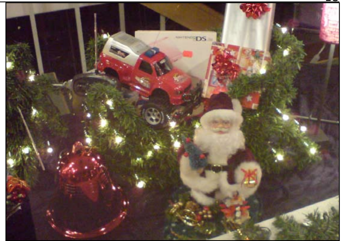
Gaver: Gaver er den delen av julen mange barn gleder seg mest til. Gaver finner man ofte under juletreet eller i strøpene over ovnen. Det er julenissen som ofte kommer med gavene.

Den 24. desember er "Christmas Eve", barna blir fortalt at om kvelden, mens de sover, kommer julenissen, trukket av sine 12 reinsdyr, ned gjennom pipa og hvis de har vært snille, legger han igjen gaver til dem.