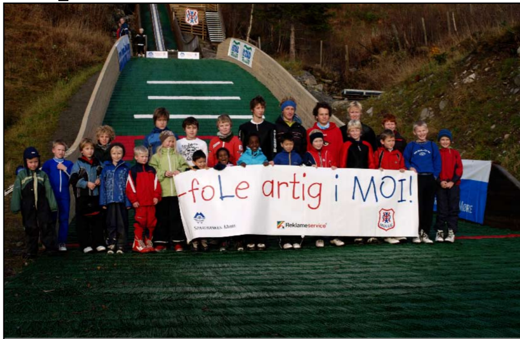
Etter rennet: Mange fornøyde hoppere i Mølleråsen etter rennet!