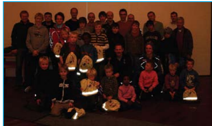
Storfornøyd: Mange fornøyde hoppere etter "Take off-07" arrangementet i kantina på Brunvoll!

koste seg i kirkekjelleren, om det var å spille biljard, klatre, spille pingpong, skyte med luftgevær, eller å ta det rolig og prate med andre hoppere/hoppforeldre.