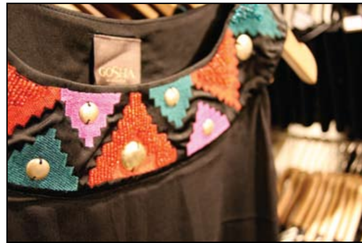
Fin festkjole med "indianer" mønster, for alle som vil fremheve seg litt mer på festen. Fin mønster som blir enda finere med paljetter og perler.