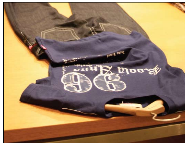
Baggybukse med t-sjorte, hotest hele året. Kan kombineres med forskjellige topper og smykker.

Den blonde jenten hadde på seg en stilig hatt, som passer både til fest og hverdag! Et topp med lange armer og et sølv kjole som passer til alt. Begge har smykke som passer veldig bra til anledningene.