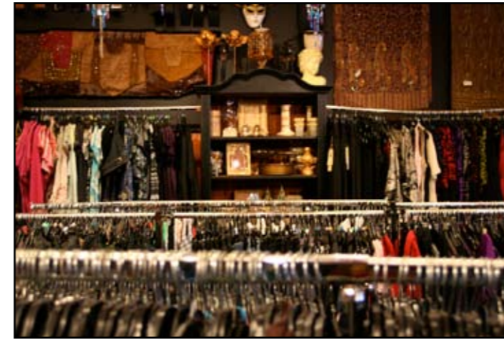
Her har vi da kommet til Bohem. Helt annerledes enn MAH (Miles A Head), men ellers en fin butikk. Fotografen tok bildet av veggene med klærne på stativet. Og en skap i midten som passer godt inn i helhets bildet til Bohem!