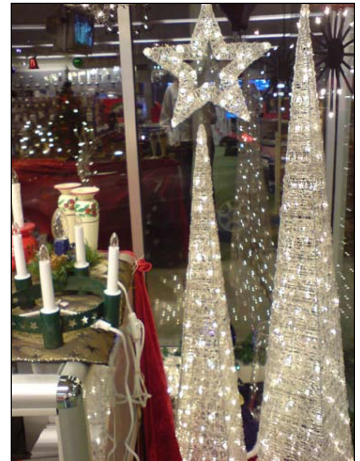
Julepynt: Julepynt er en fast tradisjon i alle hjem rundt om i verden.

Kristne og ikke kristne feirer jul som en vanlig familiefest.