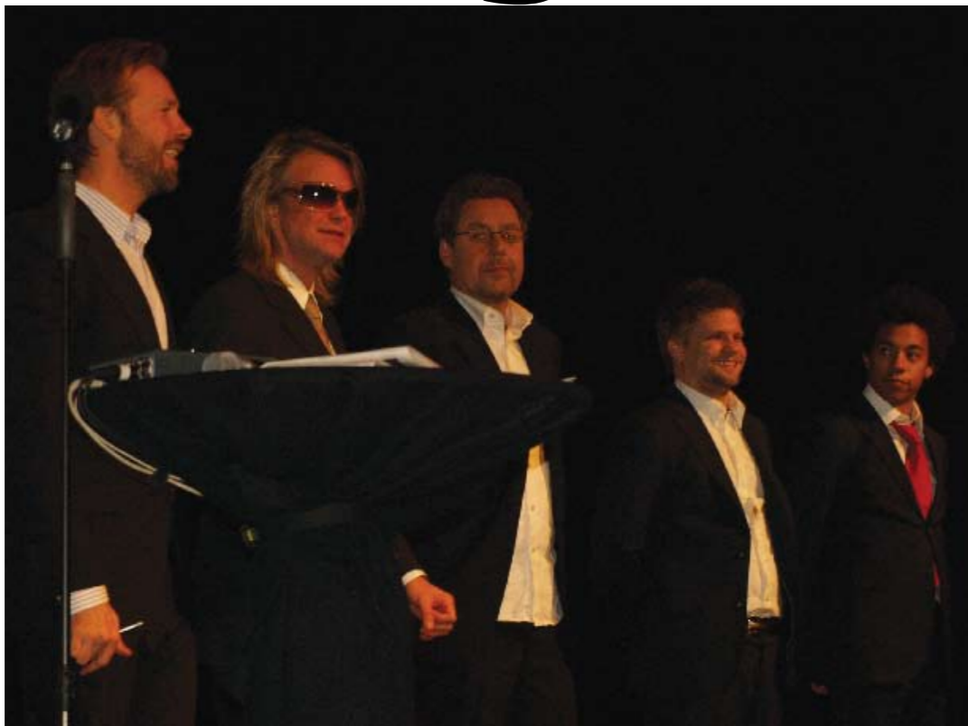
Stramme karer: Alle komikerene takker for seg etter et fantastisk "humorshow"